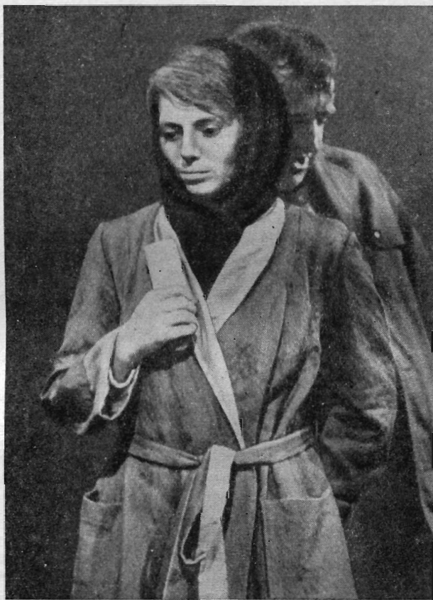
Рис. 1. Сцена из спектакля «Час пик» в постановке В. Лохницкого в Театре С. К. Неймана в Праге

Интересно и своеобразно была осуществлена постановка этой пьесы в Театре им. С. К. Неймана, премьера которой состоялась 2 ноября 1971 г. (режиссер спектакля Вацлав Лохницкий, постановка Владимира Синеки). На сцене пражского театра режиссер В. Лохницкий показал калейдоскоп сенок из современной варшавской жизни. Пьеса осуждает и высмеивает такие человеческие пороки, как карьеризм, неискренность, приспособленчество, встречающиеся еще в социалистическом обществе.