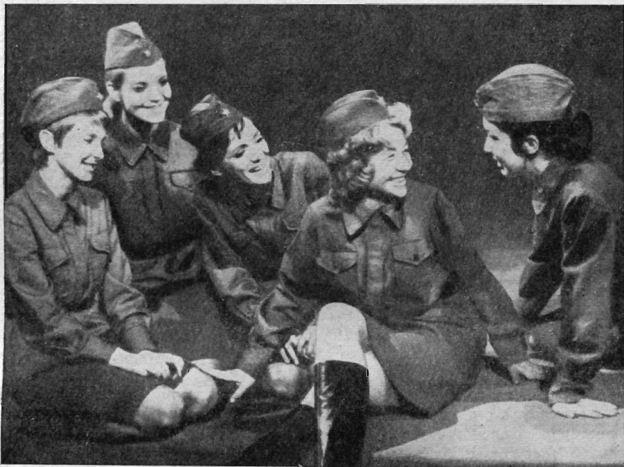
Рис. 2. Сцена из спектакля «Ангелы» в постановке З. Мики в Театре на Виноградах в Праге

В инсценировке В. Горачека не акцентируется внимание на мелких конфликтных ситуациях, которые сопровождают действие в течение всего представления. Он стремится подчеркнуть пафос, свойственный повести Васильева, страстный протест писа-